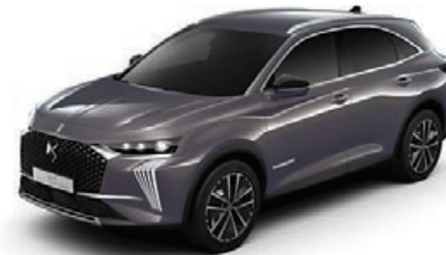
šedá NIGHT FLIGHT (M) M0A1