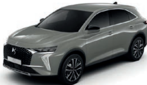
Šedá LACQUERED (M) M0SC