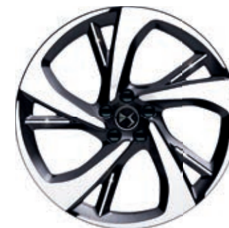
Hliníkový disk 20" TOKYO