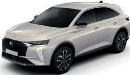
Bílá CRISTAL PEARL (M) M0PH