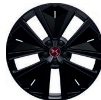
Hliníkový disk 19" SILVERSTONE