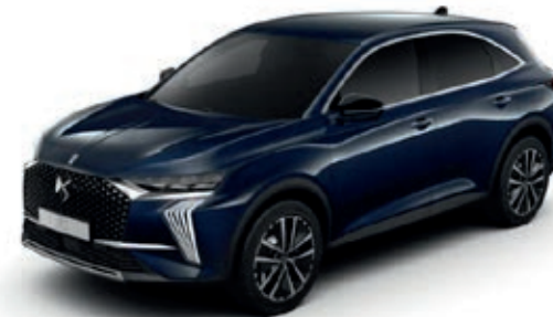
Modrá SAPHIR (M) M06L