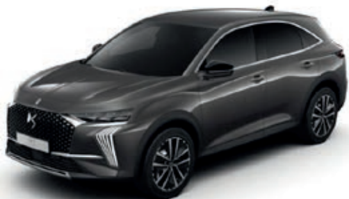
Šedá TITANE (M) 1JMO