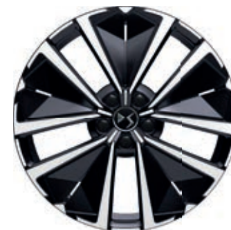
Hliníkový disk 19" EDINBURGH