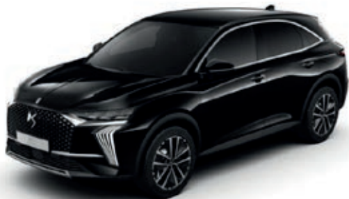
Černá PERLA NERA (M) M09V